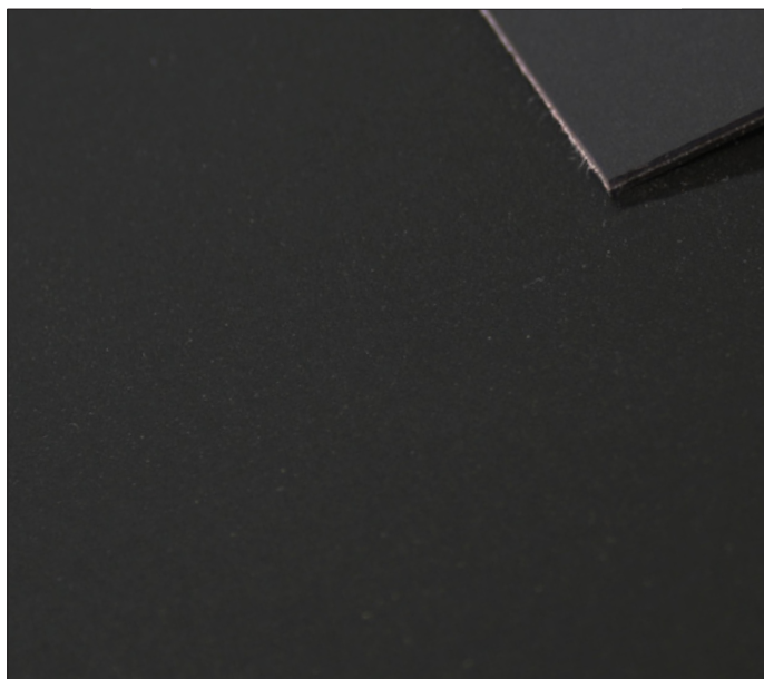
99 - Nero / Black