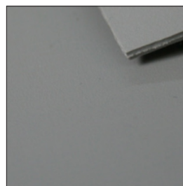
92 - Grigio / Grey